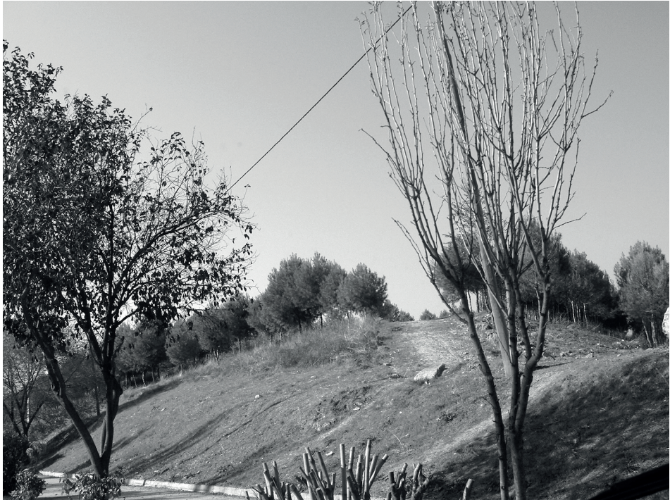
Figura 4. Parque del Cerro.

contaba con reservas de suelo cercanas al estándar legal obligatorio de 5 m 2 /hab. Así lo valoraba el Plan General. Estas zonas, sumadas a los jardines privados, daban un estándar total de 6,3 m 2 /hab., pero la distribución no era homogénea. De hecho el 53 % de las zonas verdes y reservas estaban concentradas en el llamado Parque del Cerro (Fig. 3, B4 y Fig. 4), muchas de ellas en cuesta, muy poco aptas para las actividades que se pueden desarrollar en un parque.