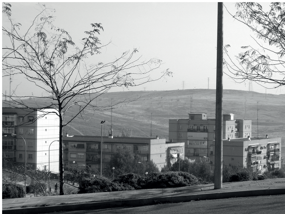
Figura 2. Ciudad San Pablo.

El 23 de julio de 1971 se aprobó el primer Plan General de Ordenación Urbana de Coslada (PGOU), redactado por la Comisión de Planeamiento y Coordinación del Área Metropolitana de Madrid, y sus repercusiones en el municipio fueron inmediatas ya que se pudieron urbanizar todos los vacíos existentes entre el Núcleo y las promociones que estaban naciendo. La vía férrea que atravesaba el municipio por medio de los campos quedó en el centro de la ciudad. Con el tiempo se convertirá en la Estación de Cercanías de Coslada (Fig. 3, B3), de la misma forma que ocurrirá en otros municipios del Corredor del Henares. El planeamiento urbano estaba convirtiendo pueblos en ciudades.