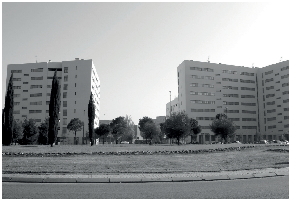
Figura 6. Puerta de Coslada.

teórica de las altas densidades del suelo residencial cosladeño, buscó por todos los medios su aumento como fue en el llamado “SUNP Sector-1” en 1993. Un recurso tuvo que parar sus intenciones.