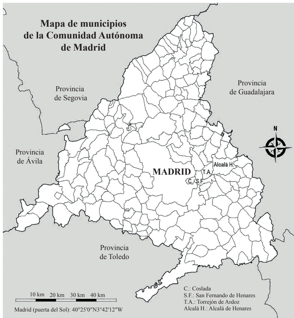
Figura 1. Mapa de municipios del Área Metropolitana Este de la Comunidad Autónoma de Madrid.