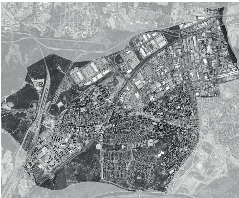
Figura 5. Foto aérea del Municipio de Coslada.

Ecológica y, al mismo tiempo, el primer municipio del Área Metropolitana en colmatar de viviendas e industria todo su término municipal (Fig. 5). No solo eso, sino que cuando se terminó de construir agotando todas las posibilidades legales del término municipal, se continuó captando terrenos no edificables, reclasificándolos (incluso a otros municipios limítrofes) para su política de suelo residencial, independientemente del gobierno municipal que estuviera y de su orientación política. Aquí es donde la geografía de la percepción plantea los interrogantes: ¿tan importantes son los intereses medioambientales que desaparecen ante la necesidad de construir viviendas? Nada de esto fue criticado ni por la prensa local ni nacional. No fue relevante.